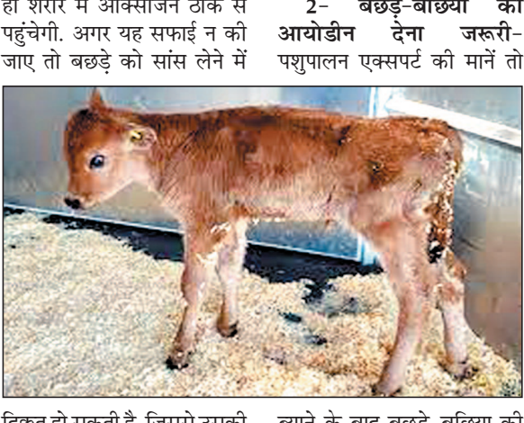
दिकत हो सकती है, जिससे उसकी जान को खतरा हो सकता है। ब्याने के बाद बछड़े-बछिया की नाभि को ऊपर से करीब आधा इंच