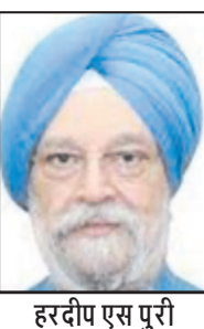
हरदीप एस पुरी

प्रधानमंत्री नरेंद्र मोदी की करिश्माई उपस्थिति और संगठनात्मक नेतृत्व की भरपूर प्रशंसा की गई है, लेकिन जिस बात को कम ही लोग जानते हैं और समझते हैं, वह यह