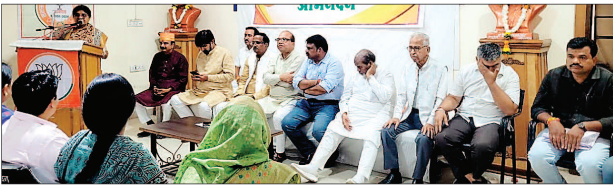
भी प्रधानमंत्री का 75 वां जन्मदिन 17 सितंबर से लगाकर 2 अक्टूबर

उज्जैन। स्वच्छता अभियान की शुरुआत प्रधानमंत्री नरेंद्र मोदी द्वारा जब की गई थी तो राष्ट्रपिता महात्मा गांधी को समर्पित करते हुए इस मिशन को आगे बढ़ाया गया। सभी प्रकल्पों में महात्मा गांधी की तस्वीर और उनके चरणों का उपयोग करते हुए धीरे-धीरे महात्मा गांधी को भाजपा ने जिस तरह से आत्मसात किया। उसे देखकर न सिर्फ देशवासी बल्कि कांग्रेसी भी हैरतमग्न रह गए। प्रधानमंत्री की सोच और उनके विजन को सभी ने तब भी सराहा, और अब खुद भाजपा