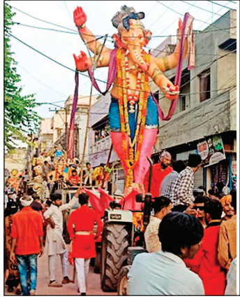
* हिन्दुओं के राजा का श्रीगणेशजी शेषनाग पर शयनमुद्रा में रहा विशेष आकर्षण। * चल समारोह को देखने उमड़ा जनसभा, सड़के हुई गुलाल से लाल-लाल।

नवभारत न्यूज, बुरहानपुर। अनंत चतुर्दशी शनिवार से प्रारम्भ श्री गणेशजी का विसर्जन चल समारोह रविवार को चंद्रग्रहण के चलते तिसरे दिवस भी हुवा श्री गणेश विसर्जन। उल्लेखनिय है कि अनंत चतुर्थी पर चंद्रग्रहण के कारण अधिकांश प्रतिमाओं का विसर्जन नहीं हो पाया था। जिसके कारण शेष रही प्रतिमाओं का विसर्जन सोमवार को सुबह से प्रारम्भ किया गया। इस विसर्जन समारोह में वैसे सभी प्रतिमाए आकर्षण और भव्य रही किन्तु हिन्दुओं के राजा की शेषनाग पर शयनमुद्रा और ब्रह्मजी का उनकी नाभी से निकलता हुवा दिखाया जाना तथा शिवलिंग को भक्तिभाव स्वरूप दिखाया गया। इसके साथ चल रहा नासीक का बैन्दु ,झांकीयों ने समा ही बांध दिया। जो विशेष आकर्षण का केन्द्र रही।