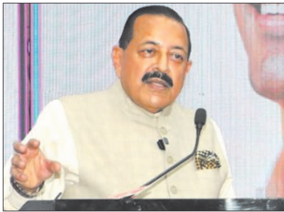
और शोध की उत्पत्ति भले ही केंपस से होती हो, लेकिन उनकी दीर्घकालिक सफलता वित्तीय सहायता, बाजार तक पहुंच और

स्टार्टअप की दीर्घकालिक सफलता उद्योग सहयोग पर निर्भर