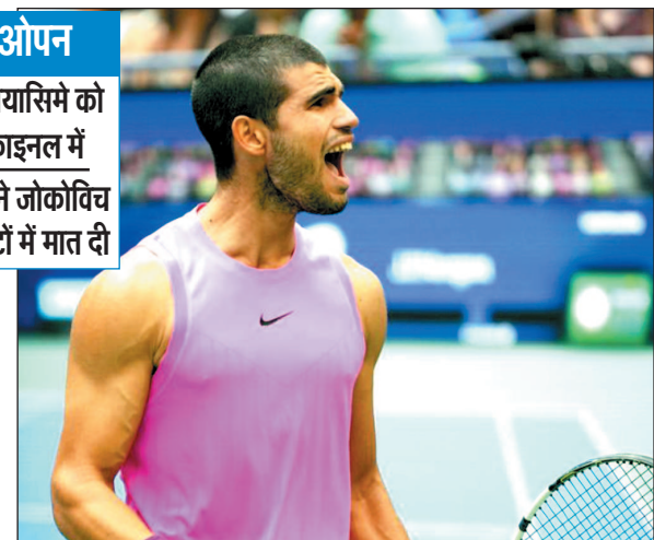
यूसुफ ओपन सिन्नर अलियासिमे को हराकर फाइनल में अल्काराज ने जोकोविच को सीधे सेटों में मात दी

न्यूयॉर्क 6 सितम्बर. डिफेंडिंग चैंपियन यानिक सिन्नर और कार्लोस अल्काराज ने यूएस ओपन 2025 के फाइनल में जगह बना ली है, जिससे एक बार फिर टेनिस जगत की सबसे रोमांचक प्रतिद्वंद्विता देखने को मिलेगी। सेमीफाइनल में सिन्नर ने फेलिक्स ऑंगर-अलियासिमे को 6-1, 3-6, 6-3, 6-4 से हराया, जबकि अल्काराज ने 24 ग्रैंड स्लैम विजेता नोवाक जोकोविच को सीधे सेटों में 6-4, 7-6 (4), 6-2 से मात दी।