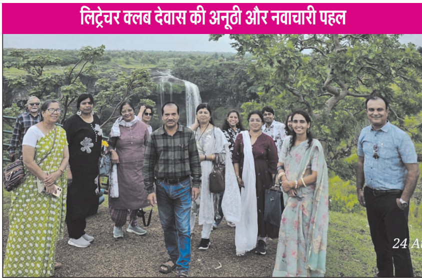
लिट्रेचर क्लब देवास की अनूठी और नवाचारी पहल