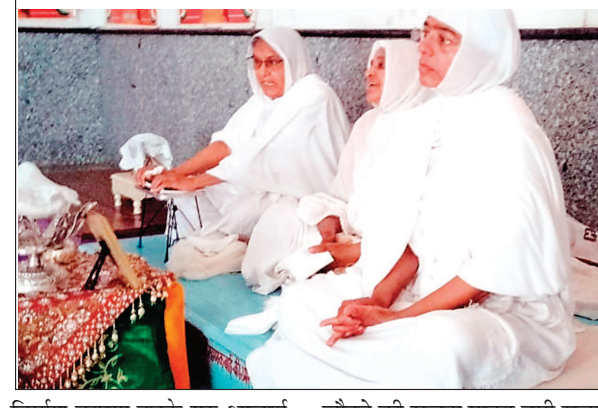
निर्माण कराया उनके गुरु आचार्य सुहस्ती सूरिश्ररजी थे। संस्कृत के सारे सूत्र जैन परंपरा के आचार्य देव भगवतो ने रचना की है, किंतु प्राकृत भाषा के सभी सूत्र आगमों से प्राप्त कर जन जन तक पहुंचाए गए हैं। सुदर्शनपुर के राजा चंद्रयश द्वारा मिथिला के नमी राजा का हाथी अपने पास रखकर नहीं