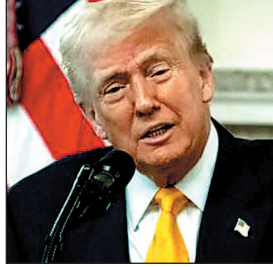
भारतीय वस्तुओं पर आयात शुल्क बढ़ाकर 01 अगस्त से 25 प्रतिशत कर दिया था जिसे 27 अगस्त को दो गुना कर 50 प्रतिशत कर दिया गया है. अमेरिका के इस कदम के बाद दोनों देशों के रिश्तों में खटास आ गयी है. ट्रंप ने कहा कि काफी कम लोग यह समझते हैं कि अमेरिका भारत से काफी कम

वाशिंगटन, 01 सितंबर (वार्ता). अमेरिका के राष्ट्रपति डोनाल्ड ट्रंप ने सोमवार को दावा किया कि भारत ने अमेरिकी उत्पादों पर आयात शुल्क घटा कर 'नगण्य' करने की पेशकश की है, लेकिन अब देर हो चुकी है. ट्रंप ने सोमवार को अपने सोशल मीडिया मंच ट्विटर पर एक पोस्ट में लिखा कि भारत ने लंबे समय से अमेरिकी उत्पादों पर दुनिया में सबसे अधिक कर लगाता आ रहा है और इस कारण दोनों देशों के बीच व्यापार एकतरफा है. उन्होंने इसे एकतरफा विनाश बताया.