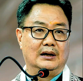
यह है कि आदिवासी समुदाय को यूसीसी के दायरे से बाहर रखा जाएगा. उन्होंने कहा कि जब देश में फौजदारी कानून सभी के लिए समान हैं तो नागरिक कानून अलग-अलग क्यों हों. इसी सोच के तहत सरकार समान नागरिक संहिता लागू करने

नयी दिल्ली, 1 सितम्बर. केंद्रीय अल्पसंख्यक कार्य मंत्री किरन रिजिजू ने स्पष्ट किया कि प्रस्तावित समान नागरिक संहिता (यूसीसी) आदिवासी और पूर्वोत्तर क्षेत्रों पर लागू नहीं होगी. उन्होंने कहा कि आदिवासी समुदायों को उनकी पारंपरिक व्यवस्था के अनुसार जीने की आजादी दी जाएगी और उनके अधिकारों की पूरी सुरक्षा की जाएगी. आरएसएस से जुड़े वनवासी कल्याण आश्रम द्वारा आयोजित एक कार्यक्रम में रिजिजू ने कहा कि इंटरनेट मीडिया पर कुछ लोग केंद्र सरकार के खिलाफ गलत नैरेटिव बढ़ रहे हैं, जबकि सच्चाई