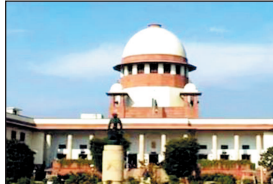
की शिकायत नहीं है. कोर्ट ने 2014 के प्रमाटी फैसले पर सवाल उठाते हुए कहा कि यह जांच आवश्यक है कि बच्चों का मुफ्त और अनिवार्य शिक्षा का अधिकार अधिनियम (आरटीई) अल्पसंख्यक शैक्षणिक संस्थानों पर किस हद तक लागू होता है. इस अब मुख्य न्यायाधीश के पास भेजा गया है, ताकि सात न्यायाधीशों की बड़ी पीठ इस पर विचार कर सके.

नयी दिल्ली, 1 सितम्बर. सुप्रीम कोर्ट ने शिक्षकों की योग्यता और अल्पसंख्यक संस्थानों के अधिकारों पर अहम फैसला सुनाते हुए कहा है कि जिन शिक्षकों को सेवा में पांच साल से कम समय बचा है, वे शिक्षक पात्रता परीक्षा (टीईटी) पास किए बिना पढ़ा सकते हैं, लेकिन उन्हें कोई प्रमोशन नहीं मिलेगा. वहीं जिनकी नौकरी में पांच साल से ज्यादा सेवा शेष है, उन्हें दो साल के भीतर टीईटी उत्तीर्ण करना अनिवार्य होगा. न्यायालय ने टिप्पणी की कि कई शिक्षक पिछले बीस वर्षों से बिना टीईटी योग्यता के पढ़ा रहे हैं और उन पर किसी प्रकार