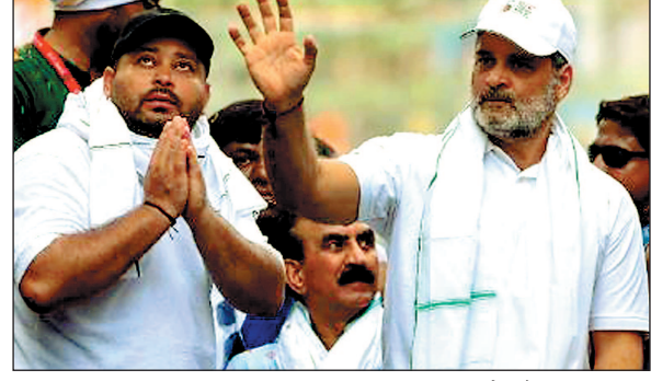
पटना, 01 सितम्बर. लोकसभा में नेता प्रतिपक्ष और कांग्रेस नेता राहुल गांधी ने सोमवार को पटना में वोट अधिकार यात्रा के समापन समारोह में कहा कि अब तक हुआ वोट चोरी का खुलासा 'एटम बम' था, आगे आने वाला खुलासा 'हाइड्रोजन बम' होगा, जिसके बाद चुनाव आयोग और भाजपा को मुंह छिपाना मुश्किल होगा. राहुल ने आरोप लगाया कि

वोट चोरी के खुलासे पर बोले राहुल गांधी ईसी और भाजपा को मुंह छिपाना होगा मुश्किल