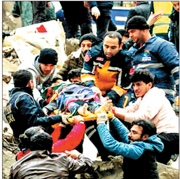
के अनुसार, रविवार रात को स्थानीय समयानुसार 11.47 बजे अफगानिस्तान के पूर्वी भाग में 6.0 तीव्रता का भूकंप दर्ज किया गया, जिसका केंद्र जलालाबाद शहर से 27 किलोमीटर दूर और आठकिलोमीटर की गहराई में था. इसके बाद सोमवार सुबह 4.5 से

नयी दिल्ली, 1 सितम्बर. अफगानिस्तान में रविवार देर रात और सोमवार की सुबह आए शक्तिशाली भूकंप ने भारी तबाही मचाई है. पाकिस्तान सीमा के निकट नंगरहार और कुनार प्रांत में आए इस भूकंप से सोमवार शाम तक 800 से अधिक लोगों की मौत हो चुकी है, जबकि 2800 से अधिक लोग घायल बताए जा रहे हैं. अमेरिकी भूवैज्ञानिक सर्वेक्षण