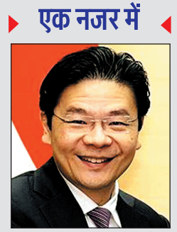
एक नजर में

सिंगापुर के प्रधानमंत्री आज भारत आयेंगे नयी दिल्ली. सिंगापुर के प्रधानमंत्री लॉरेंस वोग तीन दिन की यात्रा पर आज भारत आयेंगे साथ ही प्रधानमंत्री नरेंद्र मोदी के साथ उनकी बैठक होगी. इस बीच दोनों देशों के बीच कई समझौतों पर हस्ताक्षर किये जाने की संभावना है. वोग के साथ उनके पत्नी और एक प्रतिनिधिमंडल भी आ रहा है. दोनों देशों के बीच राजनयिक संबंधों के 60 वर्ष पूरे होने के अवसर पर हो रही इस यात्रा को महत्वपूर्ण माना जा रहा है. वोग गुरुवार को प्रधानमंत्री नरेंद्र मोदी के साथ बैठक करेंगे. इस दौरान दोनों देशों के बीच कौशल विकास, डिजिटल सहयोग, विमानन और जहाजरानी क्षेत्र में कई समझौतों पर हस्ताक्षर किये जाने की संभावना है.