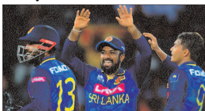
श्रीलंकाई टीम इस प्रकार है

चरित असालंका (कप्तान), पथुम निसंका, कुसल मंडिस, कुसल परेरा, नुवानिंदु फर्नांडो, कामिंडु मंडिस, कामिल मिशारा, विशेन हलंबगे, दासुन शनाका, दुनिथ वेलालागे, चमिका करुणारत्ने, महीश थीक्षाना, दुशान हेमंथा, दुम्पुथ चमीरा, विनुरा फर्नांडो, नुवानु तुषारा और मथीशा पथिराना।