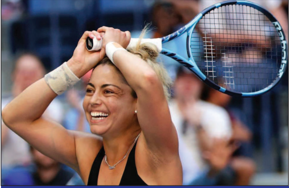
यू.एस. ओपन टेनिस

एजेंसी (आरयूसएडीए) उन तीन संगठनों में से एक है जो विश्व डोपिंग रोधी संहिता का पालन नहीं करते हैं। 22 सितंबर, 2023 को, वाडा कार्यकारी समिति ने निर्णय लिया कि सितंबर 2022 में एक वचुअल ऑडिट के दौरान पहचाने गए राज्य विधान में विसंगतियों के कारण आरयूसएडीए को पूर्ण दर्जा नहीं दिया जाएगा। आरयूसएडीए ने वाडा के निर्णय पर आपत्ति जताते हुए एक औपचारिक नोटिस भेजा। वाडा ने आरयूसएडीए के अनुपालन न करने के मामले को खेल पंचाट न्यायालय (केस) के पास भेज दिया।