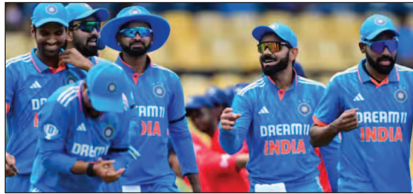
टीम इंडिया की टाइल स्पॉन्सर बनीं, खूब सारा मुनाफा भी कमाया, लेकिन आगे चलकर डूबने की कगार पर आ पहुंचीं.

का नाम जुड़ गया है. दरअसल नए ऑनलाइन गेमिंग बिल की मार ड्रीम 11 पर भी पड़ी है. नया ऑनलाइन गेमिंग बिल पहले ही राज्यसभा में पास हो चुका है. राष्ट्रपति से मंजूरी के बाद यह नए कानून में बदल जाएगा. बस उसी के बाद ड्रीम11 को भारत से बोरिया-बिस्तर समेटना पड़ेगा. मगर इससे पहले सहारा, ओप्यो समेत कई सारी कंपनी