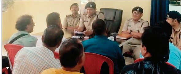
धरम-करम करा देंगे। मौत का साया हट जायेगा, लेकिन कुछ दान दक्षिणा देना पड़ेगी। वृद्धा महाराज की बात सुनने के बाद घर में रुपये लेने गईं।

उज्जैन। साधु की वेशभूषा में आये 2 बदमाशों ने वृद्धा को बताया कि पुत्र पर मौत का साया है। हम उसकी रक्षा करेंगे, कुछ दान-पुण्य करना होगा वृद्धा घर में पैसे लेने गई तो साधु भी घर में आ गये और आंख में कुछ डालकर पर्स लूटकर भाग निकले 16 दिन की तलाश के बाद पुलिस ने एक बदमाश को गिरफ्तार कर लिया है। उसके साथी की तलाश जारी है।