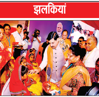
कार्यक्रम स्थल पर मुख्यमंत्री ने कामनाओं को पूजन कर किया। इस दौरान जनप्रतिनिधि मौजूद रहे।

रतलाम। मुख्यमंत्री डॉ मोहन यादव ने रतलाम जिले के प्रवास के दौरान कुण्डाल ग्राम में स्थित कोटेश्वर महादेव मंदिर पहुंच कर पूजा अर्चना की एवं प्रदेश की जनता की सुख समृद्धि की कामना की।