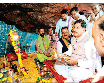
मुख्यमंत्री डॉ मोहन यादव ने कोटेश्वर महादेव मंदिर पहुंचे। यहां उन्होंने दर्शन कर पूजा अर्चना की।