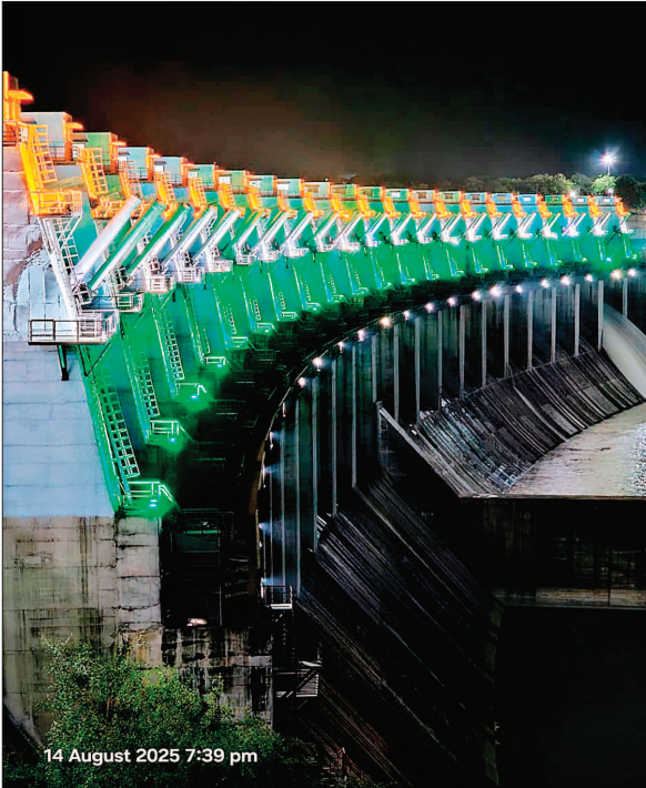
नर्मदा नगर। इंदिरा सागर बांध नर्मदा नगर एनएचडीसी द्वारा बांध के 20 गेटों को तिरंगे की रोशनी से सजाया गया जो एक आकर्षण का केंद्र है।