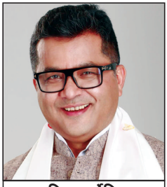
पवित्रा मार्जिता केंद्रीय वस्त्र राज्यमंत्री

हर साल 7 अगस्त को राष्ट्रीय हथकरघा दिवस एक ऐसे क्षण का प्रतीक है जो भारत के अतीत को उसके भविष्य से धागे-दर-धागा, कहानी-दर-कहानी जोड़ता है. यह दिन 1905 के स्वदेशी आंदोलन का स्मरण करता है, जब हाथ से बुना कपड़ा न केवल एक वस्त्र के रूप में, बल्कि प्रतिरोध, आत्मनिर्भरता और सांस्कृतिक पहचान के एक सशक्त प्रतीक के रूप में उभरा. एक नई शुरुआत के रूप में प्रारंभ हुआ यह प्रतीक विरासत, कला और सामुदायिक अभिव्यक्ति के ताने-बाने में बदल गया. हथकरघा क्षेत्र आज ग्रामीण और अर्ध-शहरी भारत में 35 लाख से अधिक बुनकरों और संबद्ध श्रमिकों को रोजगार देता है, जिनमें से 72 प्रतिशत महिलाएँ हैं. अपनी समृद्धि के कारण, यह क्षेत्र अब एक ऐसे दौर में खड़ा है, जहाँ इसे बिना किसी कमी के नवाचार, बिना किसी अभाव के तकनीक और बिना किसी ह्रासिफ के आधुनिकीकरण की आवश्यकता है. एक स्थायी विरासत- भारत में हथकरघा बुनाई की समृद्ध विरासत हड़पा