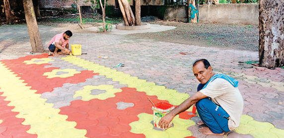
मनकामनेश्वर मंदिर में अपने खर्च पेवर ब्लॉक पर कर रहे रंग रोगन

सुसनेर, 23 जुलाई. सावन के महीने में भोले के भक्त भी अपने-अपने अंदाज में महादेव को प्रसन्न करने में जुटे हुए हैं. एक ओर जहां हर कोई भगवान शिव का जलाभिषेक व बिल्व पत्र चढ़ाकर उन्हें रिझाने का प्रयास कर रहे हैं, तो वहीं दूसरी ओर कुछ भक्त ऐसे भी हैं, जो मंदिर में सेवा कार्य करके अपने जीवन का अमूल्य समयदान कर रहे हैं.