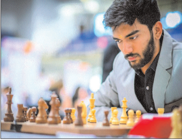
हालिया उपलब्धियां और मेजबानी का अनुभव

भारत 30 अक्टूबर से 27 नवंबर तक करेगा मेजबानी 206 खिलाड़ी नॉकआउट प्रारूप में करेंगे प्रतिस्पर्धा गुकेश, प्रज्ञानानंद, एरिगैसी बने भारत के युवा सितारे