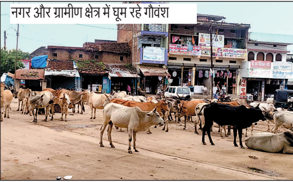
नगर और ग्रामीण क्षेत्र में घूम रहे गौवंश

कलेक्टर का आदेश केवल कागजों तक ही सीमित रह गया है। मजे की बात तो यह है कि नहर के अंदर सैकड़ों गौवंश घूमते नजर आ रहे हैं। वर्षाकाल शुरू होते ही