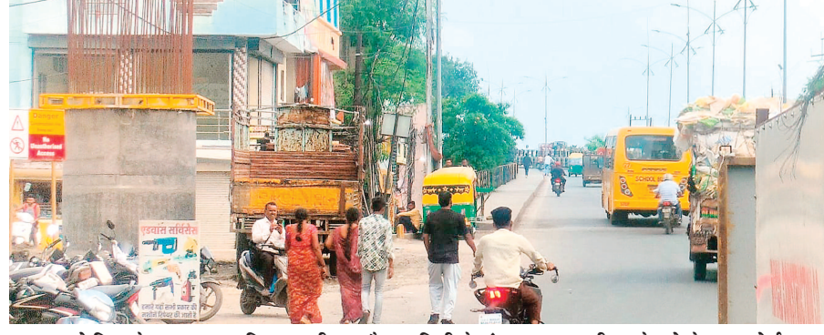
पुराने ब्रिज के पास खा नए ब्रिज का पीलर और 90 डिग्री के एंगल पर खुदा पीलर के गड्डे के बाहर बोर्ड।

नव भारत न्यूज इंदौर. इंदौर में दो ब्रिज की भुजा को लेकर पीडब्ल्यूडी की इंजीनियरिंग पर प्रश्न चिन्ह खड़े हो रहे हैं. जब इस विषय में बात की गई तो पीडब्ल्यूडी की प्रभारी कार्यपालन यंत्रो कहती हैं कि कौन सी किताब में लिखा है कि 90 डिग्री मोड़ का ब्रिज नहीं बन सकता है? उक्त कार्यपालन यंत्रो से पूछना चाहिए कि कौन सी किताब में लिखा है कि 90 मोड़ का ब्रिज बनाकर दुर्घटना स्थल बनाया जाता है. इंदौर के बाणगंगा रेलवे ओवर ब्रिज को एक भुजा का पीलर मरिमाता से उज्जैन रोड को जाने वाले ब्रिज से चिपकाकर बनाया गया है.