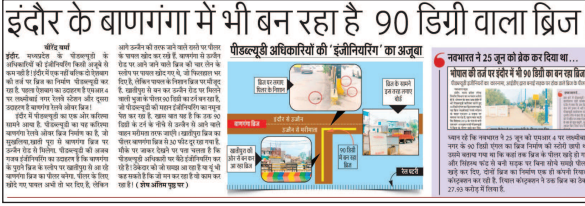
इंदौर के बाणगंगा में भी बन रहा है 90 डिग्री वाला ब्रिज!

नव भारत न्यूज इंदौर. इंदौर में दो ब्रिज की भुजा को लेकर पीडब्ल्यूडी की इंजीनियरिंग पर प्रश्न चिन्ह खड़े हो रहे हैं. जब इस विषय में बात की गई तो पीडब्ल्यूडी की प्रभारी कार्यपालन यंत्रो कहती हैं कि कौन सी किताब में लिखा है कि 90 डिग्री मोड़ का ब्रिज नहीं बन सकता है? उक्त कार्यपालन यंत्रो से पूछना चाहिए कि कौन सी किताब में लिखा है कि 90 मोड़ का ब्रिज बनाकर दुर्घटना स्थल बनाया जाता है. इंदौर के बाणगंगा रेलवे ओवर ब्रिज को एक भुजा का पीलर मरिमाता से उज्जैन रोड को जाने वाले ब्रिज से चिपकाकर बनाया गया है.