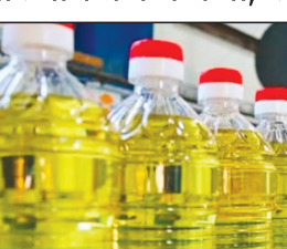
तिलहन की कीमतें नुकसान के साथ बंद हुईं। बाजार सूत्रों के अनुसार, विदेशी बाजारों में खाद्य तेलों के दाम में मजबूती और सावन में बढ़ती मांग ने अधिकांश खाद्य तेल-तिलहन में सुधार को प्रेरित

नयी दिल्ली, 13 जुलाई, विदेशी बाजारों में खाद्य तेल कीमतों में सुधार और सावन के मौसम की बढ़ती मांग के कारण बीते सप्ताह घरेलू तेल-तिलहन बाजार में सरसों, मूंगफली तेल-तिलहन, सोयाबीन तेल, कच्चे पामतेल (सीपीओ) एवं पामोलीन तेल तथा विनोला तेल के दाम में मजबूती दर्ज की गई। हालांकि, ऊंचे भाव पर डी-आयल्ड केक (डीओसी) की कमजोर मांग के कारण सोयाबीन