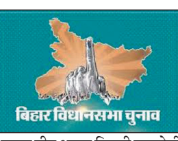
बिहार विधानसभा चुनाव

टना. बिहार विधानसभा चुनाव 2025 को लेकर भाजपा राज्य में कम आबादी वाली जातियों और छोटी पार्टियों के साथ मिलकर चुनावी रणनीति बना रही है। इसी क्रम में भाजपा के रणनीतिकारों ने शीर्ष गथा सह सम्मान समारोह आयोजित कर 'वीर शिरोमणि महाराजा बिजली पासी को न केवल धाम किया बल्कि सच्चा हितेषी भी बताया। बिहार के उप मुख्यमंत्री सम्राट चौधरी ने वीर शिरोमणि महाराजा बिजली पासी को याद किया। उन्होंने कहा कि वर्ष 2000 में