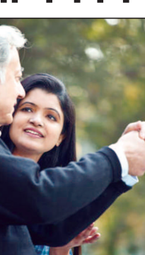
बाबूजी, आज बच्चे न तो छाता ले कर गए और न बरसाती.... भीग गए तो... जुकाम हो जाएगा और पढ़ाई का नुकसान

बहू, भीगना भी सीख का हिस्सा है. हमारे जमाने में बारिश स्कूल हुआ करती थी—छप-छप खेल, कीचड़ में सितोलिया, भीगते हुए हँसी के फव्वारे. न हाइजीन की चिंता, न सर्दी का डर... मिट्टी में लोट-पोट होना ही असली जदिगी थी.