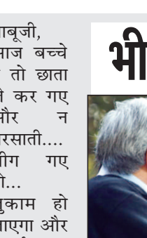
बाबूजी, आज बच्चे न तो छाता ले कर गए और न बरसाती.... भीग गए तो... जुकाम हो जाएगा और पढ़ाई का नुकसान

होगा, सो अलग! चिंता में भीगी बहू ने शिकायत की.