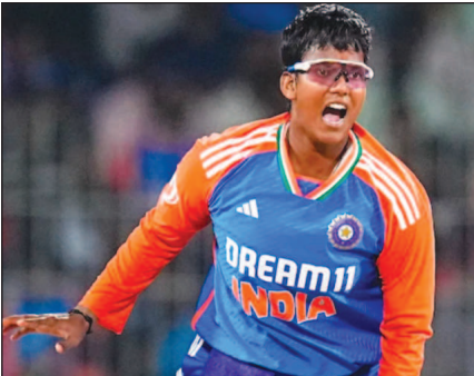
दुबई, 8 जुलाई. भारतीय स्पिनर दीप्ति शर्मा आईसीसी महिला टी 20 अंतरराष्ट्रीय रैंकिंग में दूसरे स्थान पर पहुंच गई हैं और इस तरह से अपने करियर में पहली बार नंबर एक गेंदबाज बनने की दहलीज पर खड़ी हैं। दीप्ति पिछले छह वर्षों में अधिकतर समय टी-20 गेंदबाजों की रैंकिंग में शीर्ष 10 में रही हैं, लेकिन

सादिया इकबाल से आठ रेटिंग अंक पीछे दीप्ति ने इंग्लैंड के खिलाफ भारत की पांच मैचों की टी-20 श्रृंखला के तीसरे मैच में तीन विकेट लेने के बाद अपनी नवीनतम रैंकिंग में सुधार किया है और यह ऑफ स्पिनर अंतिम दो मैच में अच्छा प्रदर्शन करके अपनी पाकिस्तानी प्रतिद्वंद्वी से शीर्ष स्थान हासिल कर सकती है।