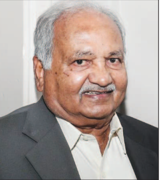
दो बार भारत आए थे। वह पहली बार 1961 में टेस्ट श्रृंखला खेलने के लिए और फिर 1978 में अहमदाबाद में

लंदन, 8 जुलाई. पाकिस्तान के पूर्व कप्तान मुश्ताक मोहम्मद भारत और इंग्लैंड के बीच टाइबेस्टन टेस्ट के चौथे दिन ऐसी टी20 पहनकर आए, जिस पर भारतीय ध्वज बना हुआ था, उस देश का तिरंगा जिसे उन्होंने छह साल की उम्र में छोड़ दिया था और उनकी दिली इच्छा एक बार फिर से भारत आने की है। इस 81 वर्षीय पूर्व क्रिकेटर का जन्म गुजरात के जूनागढ़ में हुआ था। वह अभी बर्मिंघम में रहते हैं और वहां रहकर खुश हैं लेकिन एक बार फिर से उस स्थान पर जाना चाहते हैं जहां उनका जन्म हुआ था। मुश्ताक जब क्रिकेट खेला करते थे तब