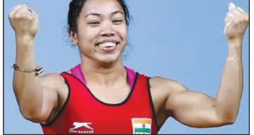
मोदीनगर, 8 जुलाई. तोक्यो ओलंपिक की रजत पदक विजेता भारोत्तोलक मीराबाई चानू ने घोषणा की है कि सैच में 90 किलोग्राम वजन उठाने का उनका लक्ष्य अभी भी बरकरार है। चोटों से जूझने के कारण पेरिस ओलंपिक में चौथे स्थान पर रहने के बाद से उन्होंने प्रतिस्पर्धा नहीं की है, लेकिन तकनीक में हालिया बदलावों ने उनके आत्मविश्वास को फिर से जगाया है।

दिलीप सरदेसाई लाभार्थ मैच के लिए भारत आए थे।