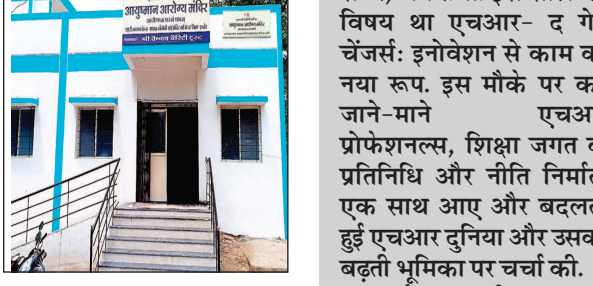
सुबह 10 बजे से शाम 6 बजे तक खुले रहेंगे. इनके जरिये सामान्य ओपीडी परामर्श, गर्भवती महिलाओं की जांच और टीकाकरण और रोगों के उपचार की सेवाएँ मिलेंगी. इनमें कैंसर, उच्च रक्तचाप और मधुमेह जैसे रोगों की जांच की सुविधा भी रहेगी.

7 जुलाई को महापौर पुष्पमित्र भार्गव के मुख्य आतिथ्य में एवं क्षेत्र क्रमांक 4 की विधायक मालिनीजी लक्ष्मणसिंह गौड़ की विशेष उपस्थिति में यह क्लिनिक का उद्घाटित होने जा रहा है. संजीवनी क्लीनिक के उद्घाटन के मौके पर क्षेत्रीय पार्षद प्रिया डोगी भी उपस्थित रहेंगी. क्लिनिक का सञ्चालन श्री वैष्णव चैरिटी ट्रस्ट करेगा. वैष्णव चैरिटी ट्रस्ट के अध्यक्ष पुरषोत्तमदास पंसाही एवं मंत्री राधाकिशन सोनी ने कहा स्वास्थ्य ऐसा विषय है, जो