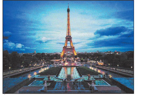
के लिए खोला गया.

एफिल टॉवर का निर्माण कार्य जनवरी 1887 में शुरू हुआ था और 31 मार्च, 1889 को समाप्त हुआ. पेरिस, फ्रांस में एफिल टॉवर को गंभीर सेलेब का दर्जा प्राप्त है. यह दुनिया में सबसे अधिक पहचाने जाने वाले स्मारकों में से एक है. और यह स्थल, जिसे आयरन लेडी के नाम से भी जाना जाता है, यहाँ प्रति वर्ष लगभग सात लाख पर्यटक आते हैं. लेकिन अपनी प्रसिद्धि के बावजूद, टावर में कुछ स्मारकीय रहस्य हैं. टावर 320 मीटर (1,050 फीट) ऊंचा है, लगभग 81 मंजिला इमारत की ऊंचाई के बराबर. अपने निर्माण के दौरान यह विश्व स्तर पर सबसे ऊंची मानव निर्मित संरचना बन गई, जिसने न्यूयॉर्क शहर की क्रिसलर बिल्डिंग को लगभग 200 फीट (61 मीटर) पीछे छोड़ दिया.