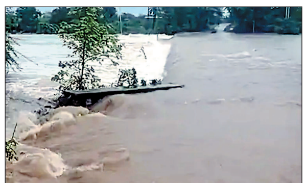
सिंगोली नगर की प्रमुख ब्राह्मणी नदी खतरे के निशान से ऊपर बह रही है. शहर की चारों दिशाओं से आने-जाने वाले रास्ते जलभराव के कारण बंद हैं. रतनगढ़ क्षेत्र की गुंजाली नदी भी उफान पर है.

नीमच. मंगलवार रात 12 बजे से नीमच जिले के सिंगोली क्षेत्र में भारी बारिश जारी है. बारिश ने पूरे क्षेत्र को प्रभावित किया है. निचली बस्तियों में पानी भर गया है. सिंगोली-नीमच मार्ग पर यातायात पूरी तरह रुक गया है. क्षेत्र की सभी नदियां और नाले उफान पर हैं.