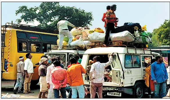
झाबुआ बस स्टैंड से जीपों में सवार होकर गुजरात की ओर जा रहे ग्रामीण...

शासन-प्रशासन के प्रयास धरातल पर साबित हो रहे फिसट्टी