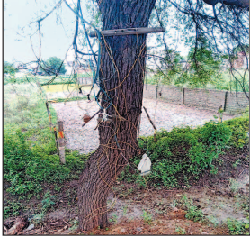
आलम यह है कि इस बबूल के पेड़ में दो-चार नहीं, बल्कि आधा सैकड़ा से अधिक खुले तार में कटिया फंसा कर अपने-अपने घर बल्ली के सहारे तार ले गये हैं। बताया जाता है कि एमपीईबी अमले की जानकारी में कटिया तार से घरों में बिजली रोशन हो

नवभारत न्यूज सिंगरौली 2 जुलाई. कचनी बस्ती के नेशनल धर्मकांटा के पीछे एक हरे-भरे बबूल पेड़ को बिजली सप्लाई का खम्भा बना दिया गया है. ताजुब इस बात का है कि एमपीईबी अमला बिजली विल भी वसूलता है, फिर भी अनजान बना हुआ है. एमपीईबी के इस लापरवाही से कभी भी बड़ा हादसा हो सकता है.