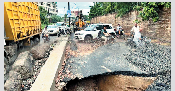
वाहन चलाने वाले दुर्घटना का शिकार हो सकते थे. हालांकि, मामला बढने पर कलेक्टर ने इस मामले पर सजाजान लिया और इसका पैच वर्क करवाया. लेकिन अब गौर करने वाली बात यह है कि लगातार

ग्वालियर. मध्य प्रदेश के ग्वालियर में भ्रष्टाचार की पोल वक्त खलुल गई जब 18 करोड़ की लागत से बनी सड़क धंसी गई. ऐसा पहली या दूसरी बार नहीं बल्कि सातवीं बार हुआ है. हेरान करने वाली बात यह है कि इसे 15 दिन पहले ही बनाया गया था. दरअसल, यह सिंधिया महल के पास चेतकपुरी रोड में भ्रष्टाचार का यह ताजा उदाहरण देखने को मिला है. इस सड़क पर इतने बड़े गड्ढे हो गए थे, जैसे किसी दूसरी जगह जाने के लिए सुरंग बना दी गई हो. भारी बारिश होने पर गड्ढों में पानी भर जाने पर सड़क पर