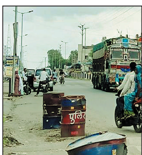
परेशानी हो रही है.

सुसनेर, 1 जुलाई. शहर से गुजर रहे उज्जैन-झालावाड़ राष्ट्रीय राजमार्ग 552 जी पर पिछले एक महीने से स्ट्रीट लाइट बंद है, जिसके कारण राहवासियों के साथ ही वाहन चालकों को भी काफी परेशानियों का सामना करना पड़ रहा है.