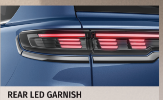
REAR LED GARNISH