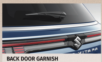
BACK DOOR GARNISH