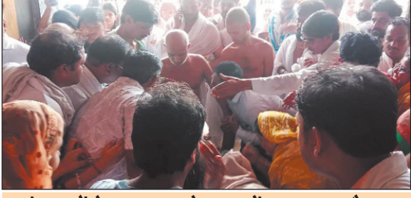
संत जनों के आगमन से नगर में उमड़ा जनसैलाब