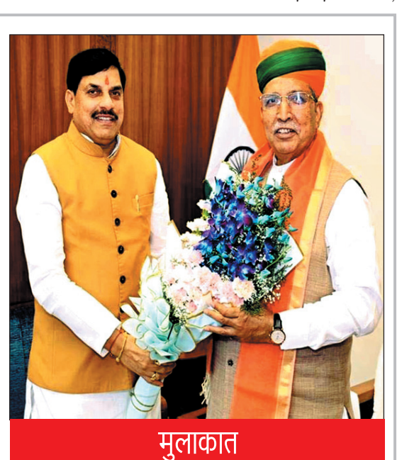
मुलाकात नई दिल्ली, 28 मई. देश के केंद्रीय और कानून मंत्री अर्जुन मेघवाल से मध्यप्रदेश के मुख्यमंत्री डॉ. मोहन यादव ने की मुलाकात.

धार. मध्यप्रदेश में धार लोकसभा क्षेत्र की सांसद सावित्री ठाकुर ने केंद्रीय पर्यटन एवं संस्कृति मंत्री गजेंद्र सिंह शेखावत से मुलाकात कर लंदन के संग्रहालय में सुरक्षित मां वाग्देवी की प्रतिमा को भारत वापस लाकर भोजशाला में पुनर्स्थापित करने का आग्रह किया है. आधिकारिक जानकारी के अनुसार सांसद सावित्री ठाकुर ने केंद्रीय मंत्री को पत्र सौंपकर प्रतिमा को शीघ्र भारत लाने की मांग की. उन्होंने भोजशाला सरस्वती मंदिर को करोड़ों हिंदुओं की आस्था का केंद्र बताते हुए इस विषय को प्रमुखता से उठाया. सांसद के निमंत्रण पर केंद्रीय मंत्री गजेंद्र सिंह शेखावत ने जून माह में धार आने की सहमति दी है.