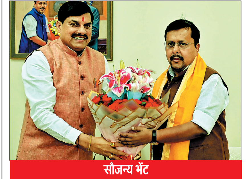
सौजन्य भेंट नई दिल्ली, 26 मई. भारतीय जनता पार्टी के राष्ट्रीय अध्यक्ष नितिन गडकरी ने मंगलवार को मुख्यमंत्री डॉ. मोहन यादव ने नई दिल्ली में सौजन्य भेंट की.

शोषण) शीर्षक वाले इस दस्तावेज में पोप ने सरकारों से एआई तकनीक के विकास की रफ्तार को धीमा करने का आग्रह किया है. उन्होंने सचेत किया कि एआई प्रणालियों गलत जानकारी फैला रही हैं.