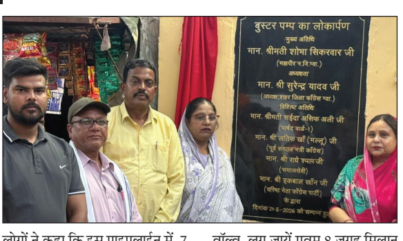
लोगों ने कहा कि इस पाइपलाईन में 7