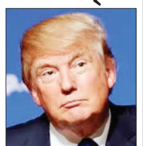
राष्ट्रपति ने जजों को 'बर्खास्त' करने की दी चेतावनी

इस फैसले को कानूनी चुनौती हजारों व्यवसायों का प्रतिनिधित्व करने वाले कई प्रमुख अमेरिकी व्यापार संघों ने दी थी. अदालत संघों के इस तर्क से सहमत थी कि राष्ट्रपति विधायी मंजूरी के बिना एकतरफा रूप से