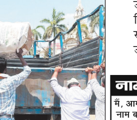
को हटाय जाकर सामान जती की कार्यवाही की गई।

ग़ालियर 6 मई. नगर निगम के मदाखलत अमले द्वारा सुगम यातायात के लिए शहर के विभिन्न स्थानों से अस्थाई अतिक्रमण हटाने की कार्रवाई की गई।