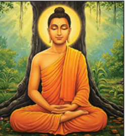
भूमि जहाँ परमापावन दलाई लामा ने अपनी शिक्षाएँ दी हैं इस प्रदर्शनी के आयोजन-स्थल होंगे.

श्रेणी की सुरक्षा के साथ, एक विशेष विमान में, वे 29 अप्रैल को लेह पहुँचेंगे और पंद्रह दिनों तक, 1 से 15 मई तक, शुभ 2569वीं वेसाक बुद्ध पूर्णिमा के पावन अवसर से आरंभ होकर, दुनियाभर के श्रद्धालुओं, भूमि जहाँ परमापावन दलाई लामा ने अपनी शिक्षाएँ दी हैं इस प्रदर्शनी के आयोजन-स्थल होंगे. और अवशेष केवल लेह तक सीमित नहीं रहेंगे. 11 और 12 मई के बीच वे सुदूर जांस्क घाटी की यात्रा करेंगे उस समुदाय तक बुद्ध की कृपा पहुँचाने के लिए, जिनकी बौद्ध परंपराएँ उनके परिदृश्य की खाइयों जितनी गहरी हैं.