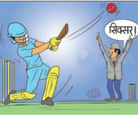
अमिताभ बच्चन को एंग्री यंग मैन कहा जाने लगा था. गुलशन ग्रोवर को बैड मैन कहते थे. कार्टून की दुनिया में आर. के. लक्ष्मण का कॉमन मैन चर्चित था. पड़ोसी ने कहा, 'निशानेबाज जब कॉमन मैन स्पेशल मैन

हमने कहा, 'आप हिट मैन की इतनी तारीफ कर रहे हैं लेकिन क्रिकेट में बाउंड्री के करीब फोल्डर करने वाला थर्ड मैन भी तो रहता है. ईरान-अमेरिका वॉर में पाकिस्तान मिडल मैन की भूमिका निभा रहा है. फिल्मों में धर्मद्र को ही-मैन कहते थे. जंजीर व दीवार जैसी फिल्मों के बाद