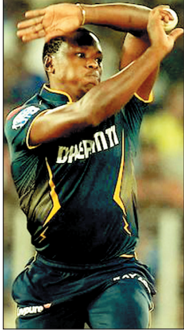
रबाड़ा ने तेज और सटीक गेंदबाजी से तीन महत्वपूर्ण विकेट हासिल किए

अहमदाबाद, 20 अप्रैल. आईपीएल के रोमांचक मुकाबले में मुंबई इंडियंस ने पहले बल्लेबाजी करते हुए गुजरात टाइटंस के सामने 200 रनों का चुनौतीपूर्ण लक्ष्य रखा. तिलक वर्मा की शानदार शतकीय पारी और नमन धीरे के उपयोगी योगदान के दम पर मुंबई ने 20 ओवर में पांच विकेट के नुकसान पर 199 रन बनाए.