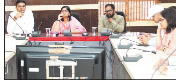
समीक्षा की। बुधवार को कलेक्टर के सभागार में आयोजित हुई बैठक में साधना ससाह, ग्रीष्म ऋतु को ध्यान में रखकर बनाई गई पेयजल कार्ययोजना व सीएम हेल्पलाइन सहित शासन की प्राथमिकता वाले अन्य कार्यक्रमों की भी समीक्षा की गई। बैठक में अपर कलेक्टर कुमार सत्यम एवं जिला पंचायत के मुख्य कार्यपालन अधिकारी

ग्वालियर 1 अप्रैल. ग्वालियर शहर में वार्डवार कार्ययोजना बनाकर जल गंगा संवर्धन अभियान के तहत जल संरक्षण व संवर्धन के कार्य कराए जाएं। साथ ही नालों के कैचमेट के अतिक्रमण प्रमुखता से हटवाएँ, जिससे बरसात के दौरान जल भराव की स्थिति निर्मित न हो। इस आशय के निर्देश कलेक्टर रुचिका चौहान ने अंतरविभागीय समन्वय बैठक में जल गंगा संवर्धन अभियान की समीक्षा के दौरान दिए। उन्होंने जिले में जल गंगा संवर्धन अभियान को मूर्तरूप देने के लिये विभागवार बनाई गई कार्ययोजनाओं की विस्तार से