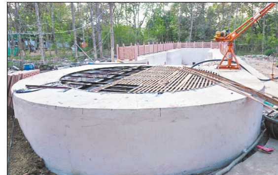
कि स्मार्ट सिटी द्वारा शहर की एसएफएफ की द्वितीय वाहिनी में बनी स्टेकाल के समय की बावड़ी, सेनापति हनुमान मंदिर कांचमौल, एवं इटालियन गार्डन में बनी बावड़ियों को पुनर्जीवित करने का कार्य किया है। तीनों बावड़ियों में संधारण इत्यादि का कार्य पूर्ण हो चुका है, अब सिर्फ फिननिशिंग का कार्य चल रहा है। इस परियोजना के तहत तीनों