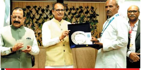
आत्मनिर्भर भारत और आयात पर निर्भरता घटाने की ठोस राह

▶ पराली से सड़क तक बायो-बिटुमेन की ऐतिहासिक पहल- शिवराज