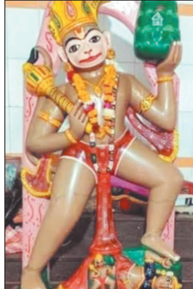
धुआ के हनुमान

हनुमान जी की प्रतिमा दिन में तीन रूप धारण करती है। सुबह बालवन, दोपहर में बाहुबली, शाम को यह मूर्ति वृद्ध रूप में नजर आती है। यह विशेषता अनोखी है। यह मंदिर लगभग 400 से 500 साल पुराना है और इसकी स्थापना दौलत राव सिंधिया ने करवाई थी। मंदिर की एक विशेषता यह है कि इसमें कोई परिक्रमा मार्ग नहीं है और भगवान हनुमान की प्रतिमा स्वाभाविक रूप से वहां मौजूद थी। धुआ वाले हनुमान जी का मंदिर शहर से लगभग 56 किलोमीटर दूर है और वहां पहुंचने में 1 घंटे 30 मिनट का समय लगता है। भक्त वहां टैक्सी या ऑटो रिक्शा लेकर मंदिर में दर्शन करने पहुंचते हैं। इस मंदिर में