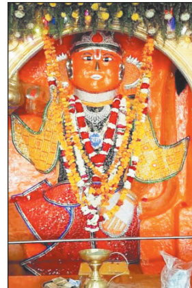
गरगज के हनुमान

भगवान हनुमान की प्रतिमा स्वयंभू है, यानी इसकी स्थापना किसी व्यक्ति द्वारा नहीं की गई थी। यह मंदिर (प्रतिमा के 3 रूप बदलने पर) इस अनोखी विशेषता और आध्यात्मिक ऊर्जा के कारण श्रद्धालुओं को अपनी ओर आकर्षित करता है। क्यो कहते हैं गरगज के हनुमान, किसने की स्थापना-बदलों में भीषण गर्जना के साथ अमरा पर्वत का आधा हिस्सा कटकर नीचे गिर गया था जिसके बाद यह प्रतिमा स्वयंभू प्रकट हुई थी। इस कारण यह सिद्ध स्थान गरगज के हनुमान मंदिर नाम से जाना जाता है। लगभग 250 साल पुराने इस प्राचीन और चमत्कारी मंदिर में लगातार 5 मंगलवार दर्शन