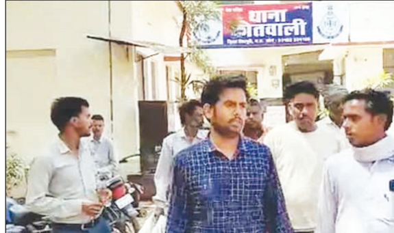
नवभारत न्यूज शिवपुरी, 17 मार्च। नेपाल शाक्य आत्महत्या मामले में अब गंभीर मोड़ ले लिया है। पुलिस ने इस प्रकरण में दो अलग-अलग थानों में एफआईआर दर्ज कर कई लोगों