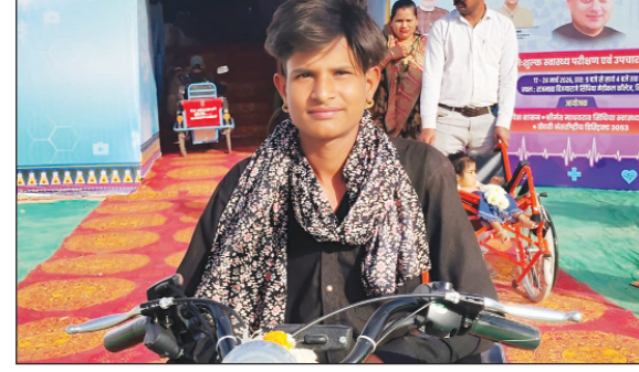
आयोजित रोटरी रीजनल मेडिकल मिशन अंतर्गत वृहद स्वास्थ्य शिविर में केन्द्रीय मंत्री ज्योतिरादित्य सिंधिया के समक्ष