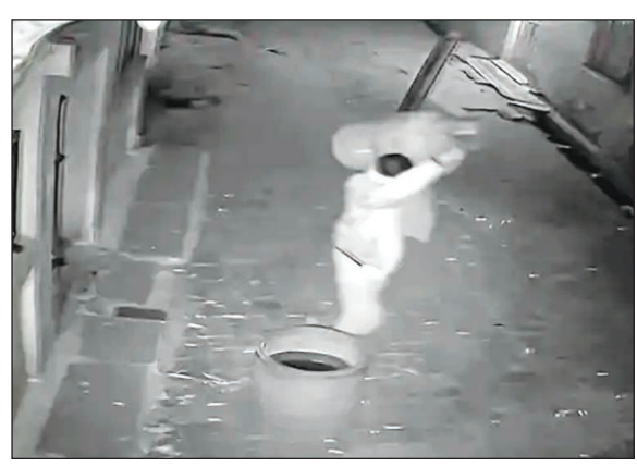
अंदाज में सिलेंडर कंधे पर रखकर ले जाता दिखाई दे रहा है।

नवभारत न्यूज शिवपुरी, 17 मार्च। शहर की कृष्णपुरम कॉलोनी में चोरों ने सूने मकान को निशाना बनाकर सनसनी फैला दी। गैस सिलेंडर