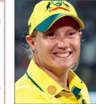
हीली को विदाई देने उतरंगी ऑस्ट्रेलियाई महिला टीम