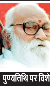
पुण्यतिथि पर विशेष

कठिनाइयों के बावजूद उन्होंने शिक्षा प्राप्त की और युवावस्था में ही राष्ट्रीय स्वयंसेवक संघ के संपर्क में आए. संघ के स्वयंसेवक के रूप में उन्होंने संगठनात्मक कार्यों में महत्वपूर्ण भूमिका निभाई और उत्तर प्रदेश में संघ के विस्तार में विशेष योगदान दिया. नानाजी भारतीय जनसंघ