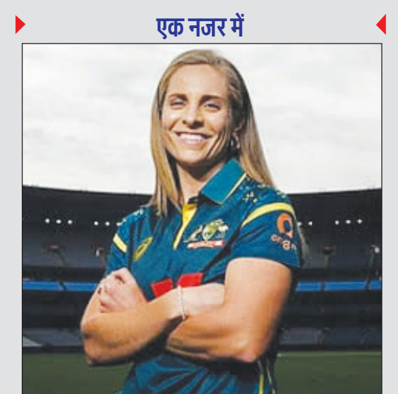
एक नजर में