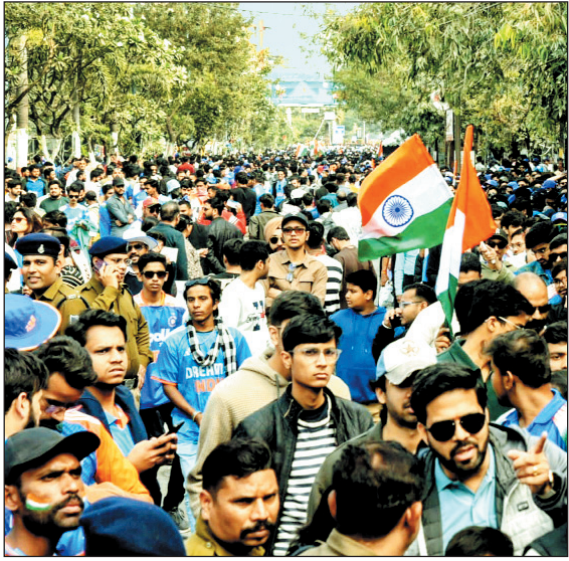
होलकर स्टेडियम के बाहर जनसैलाब