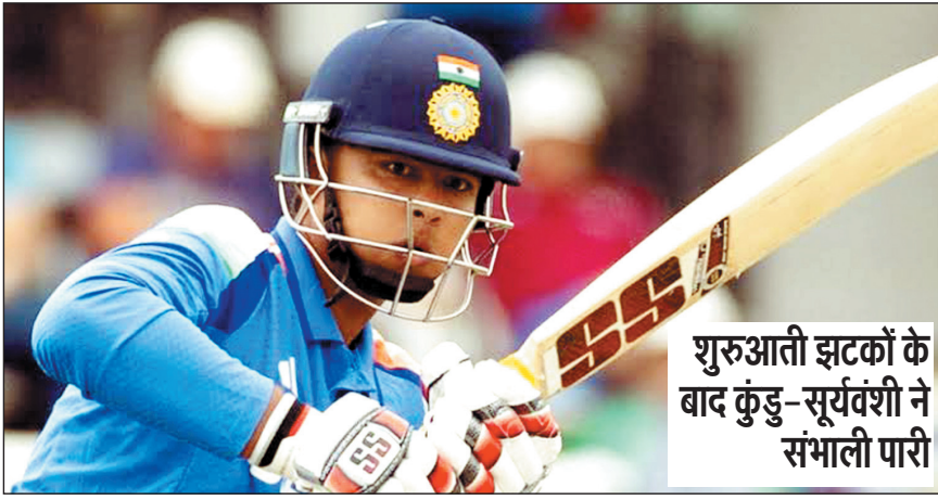
शुरुआती झटकों के बाद कुंडु-सूर्यवंशी ने संभाली पारी

बारिश प्रभावित मुकाबले में भारतीय टीम ने संघर्षपूर्ण बल्लेबाजी से खड़ा किया मजबूत स्कोर