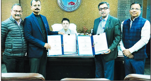
आरबीजी-प्रमुख, व्यापार प्रसार लिमिटेड द्वारा औपचारिक रूप से हस्ताक्षर किए गए। यह