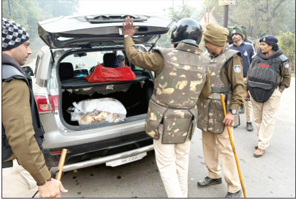
वाले एवं उन्हें शेरार व रिपोस्ट करने वालों पर भी तत्काल कार्रवाई कर उन पर प्रकरण दर्ज किया जा रहा है। शहर का माहौल