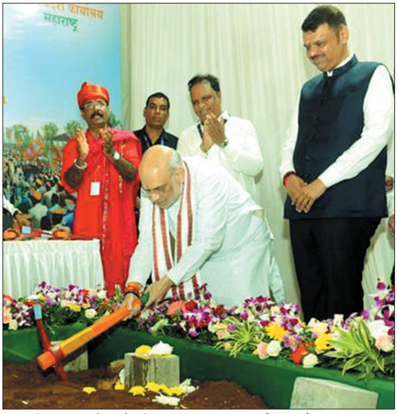
मल्टीलेवल पार्किंग और मेडिकल सुविधा केंद्र जैसी आधुनिक

राज्य की राजधानी में बनने वाला यह नया कार्यालय लगभग 55 हजार वर्ग फीट क्षेत्रफल में निर्मित होगा. इसमें छह कॉन्फ्रेंस रूम, एक आधुनिक लाइब्रेरी, 400 सीटों वाला ऑडिटोरियम,