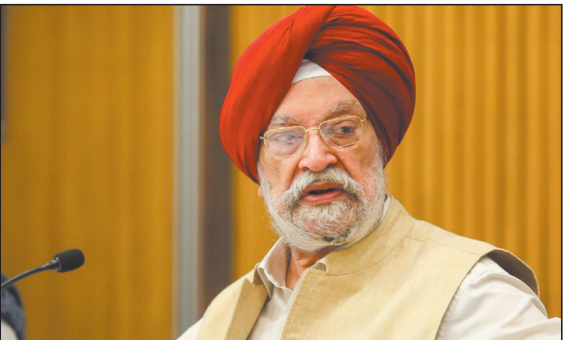
तेल खोज और निवेश में बड़ी प्रगति

उन्होंने कहा कि यह आंकड़े भारत को दुनिया का तीसरा सबसे बड़ा तेल और एलपीजी उपभोक्ता बनाते हैं.