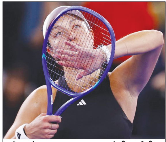
पेगुला ने 2-6, 6-4, 7-6 (7/2) से जीत दर्ज की

नई दिल्ली 11 अक्टूबर. जेसिका पेगुला ने शनिवार को वुहान ओपन के सेमीफाइनल में बेलायूस की विश्व नंबर एक आर्यना सबालेंका को एक नाटकीय 2-6, 6-4, 7-6 (7/2) जीत के साथ टूर्नामेंट में उनके शानदार रिकॉर्ड पर रोक लगा दी। इस जीत के साथ, पेगुला ने अपनी हमवतन कोको गॉफ के खिलाफ रविवार को होने वाले खिताब मुकाबले में जगह पक्की कर ली है। यह मुकाबला पेगुला की असाधारण दृढ़ता का एक प्रमाण था। पिछले 17 दिनों में, वह लगातार आठवें तीन-सेट वाले मैच में हिस्सा ले रही थीं और उन्होंने इनमें से सात में जीत हासिल की। तीसरे सेट में एक समय 2-5 से पीछे होने के बावजूद, पेगुला ने चमत्कारिक वापसी की और शीर्ष वरीयता प्राप्त खिलाड़ी को चौंका दिया। यह वापसी उनके करियर के सबसे यादगार पलों में से एक है, खासकर यह देखते हुए कि